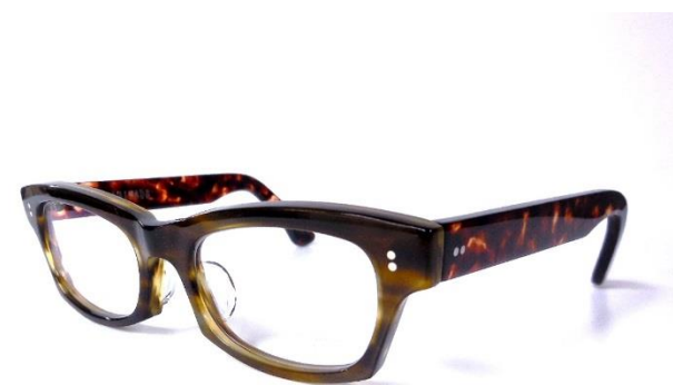
フロントとテンプルを違う生地で